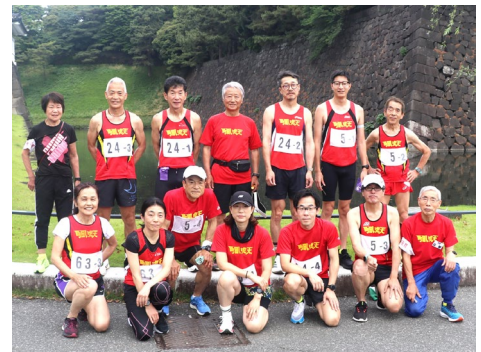
5月18日皇居東日本年令別駅伝 (皇居 桜田門 5位入賞2チーム)