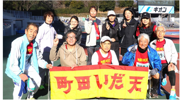
1月26日武相駅伝参加者 (町田市陸上競技場)