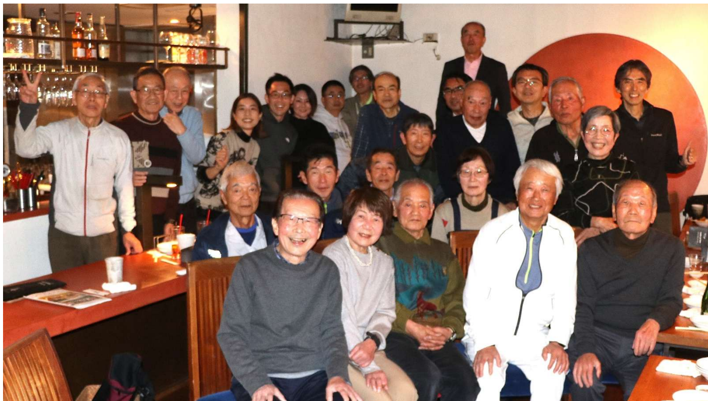
1月19日 新年会(まんま屋汁べー)