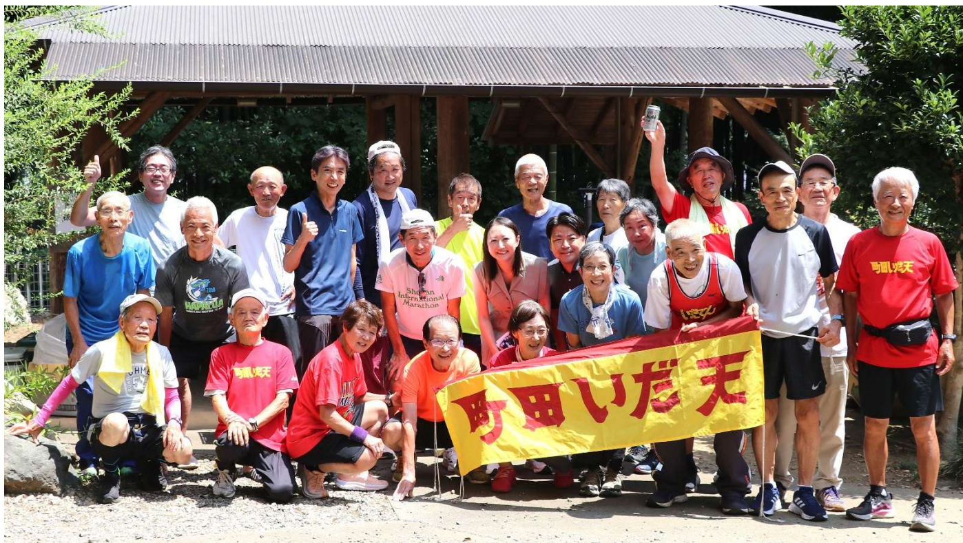
8月4日 バーベキュー参加者(竹ーガーデン)