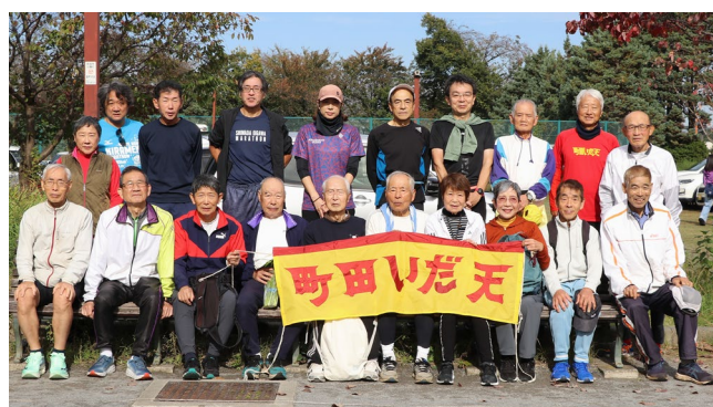
11月2日 練習会参加者 (サン町田旭体育館裏)