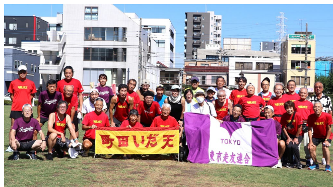
9月6日 いだ天クラブ55周年記念練習 (町田シバヒロ 東京走友連合と合同練習)