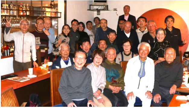
1月19日 新年懇親会参加者 (まんま屋汁ペー)