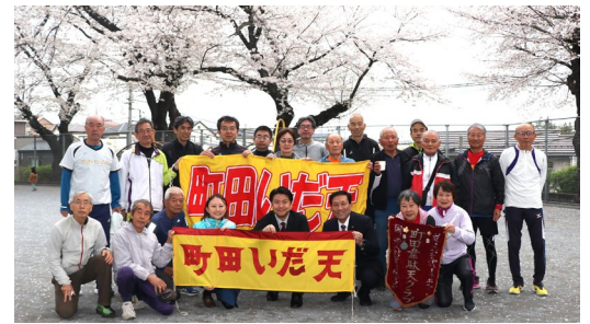
4月6日 お花見 (町田中央公園 22名参加)