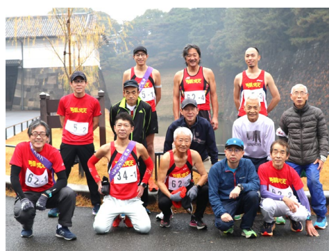
12月21日 令和7年忘年親睦駅伝 (皇居 桜田門)