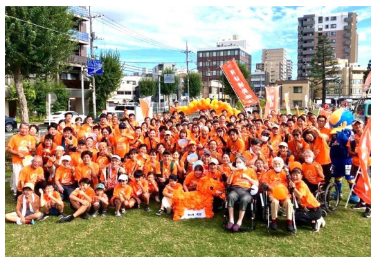
10月5日 RUN伴町田2025 町田シバヒロ いだ天クラブ5名参加