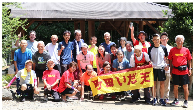
8月3日 バーベキュー大会 竹ーガーデン 26名参加