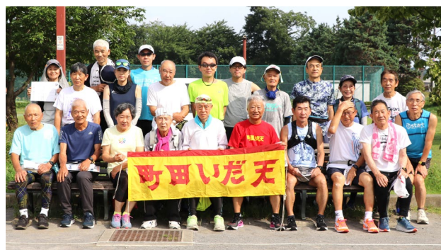
7月6日 練習会参加者22名 (サン町田旭体育館裏)