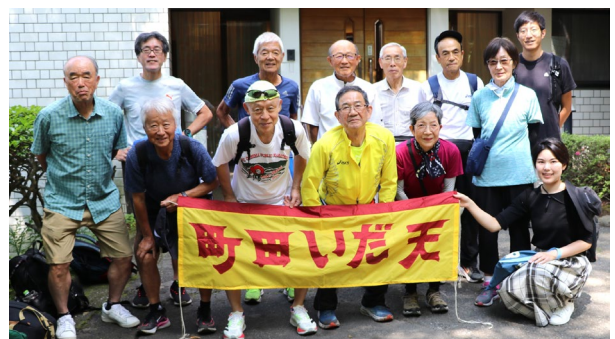
6月29日 夏季合宿 (神奈川大学保養所 13名)