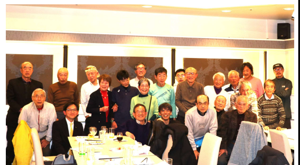
1月18日(日)新年会 (パームツリー)