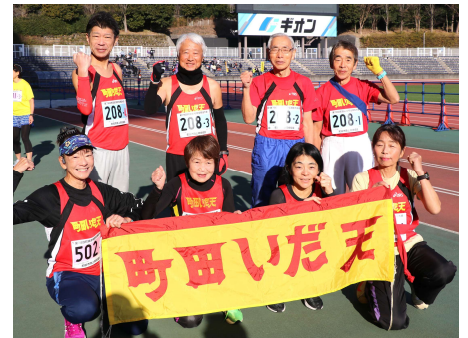
1月18日(日)武相駅伝大会選手 (町田陸上競技場)