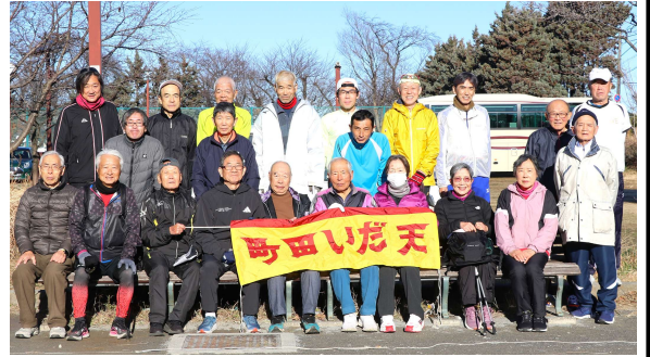
1月4日(日)新春初走り参加者 (サン町田旭体育館裏)