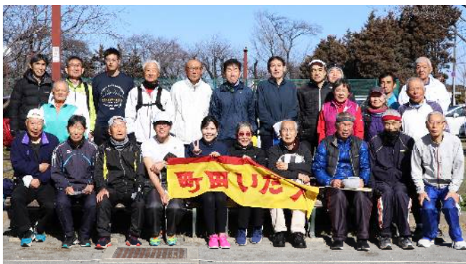
3月3日 練習会参加者 (サン町田旭体育館裏)