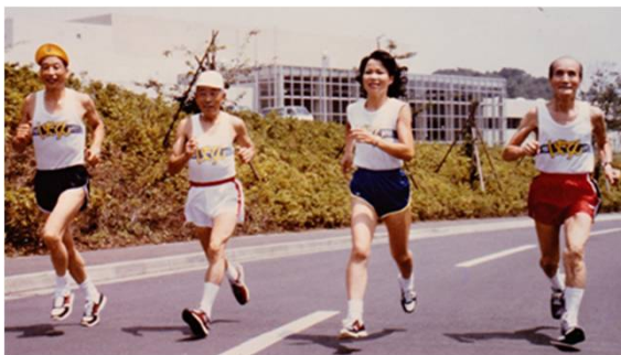
シティランナー掲載写真