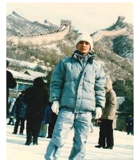
勝沼ぶどう郷マラソン 優勝 万里の長城 ← (左側優勝記録)