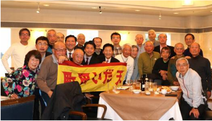
1月21日 新年懇親会参加者 (レンブラントホテル パームツリー)