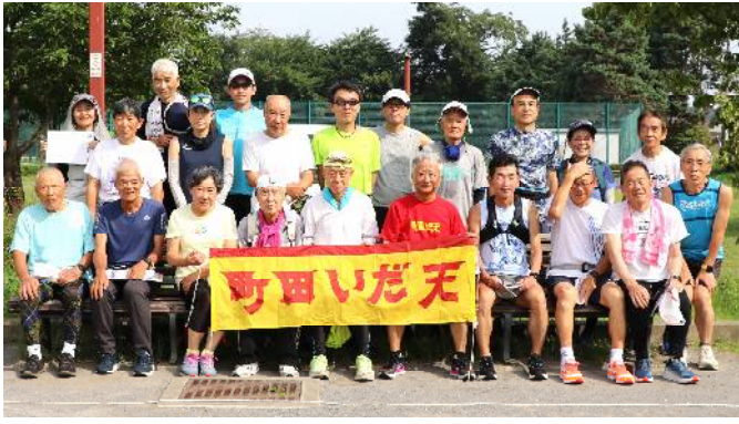
7月7日練習会参加者 (サン町田旭体育館裏)