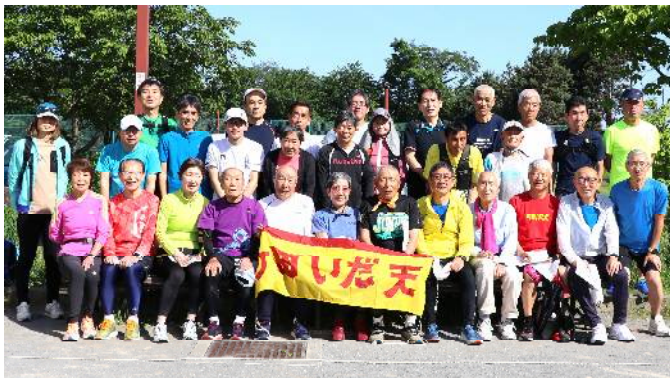
5月5日 練習会参加者 (サン町田旭体育館裏)