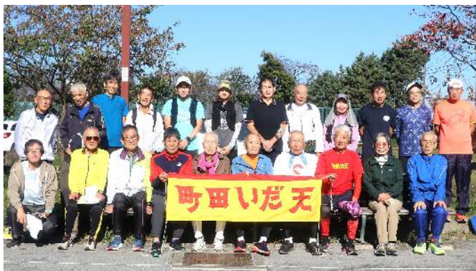
11月3日練習会参加者 (サン町田旭体育館裏)