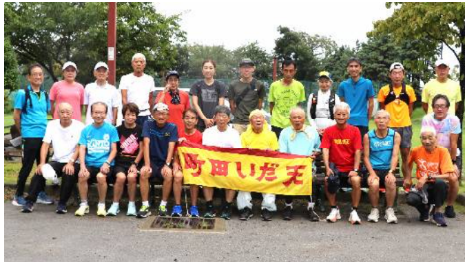
9月1日練習会参加者 (サン町田旭体育館裏)