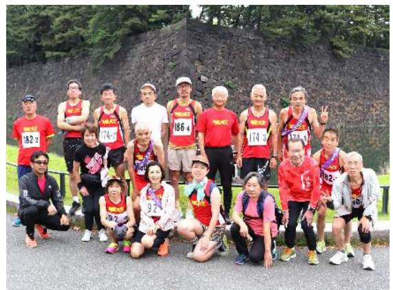
5月19日 皇居東日本年令別駅伝 (皇居 桜田門)