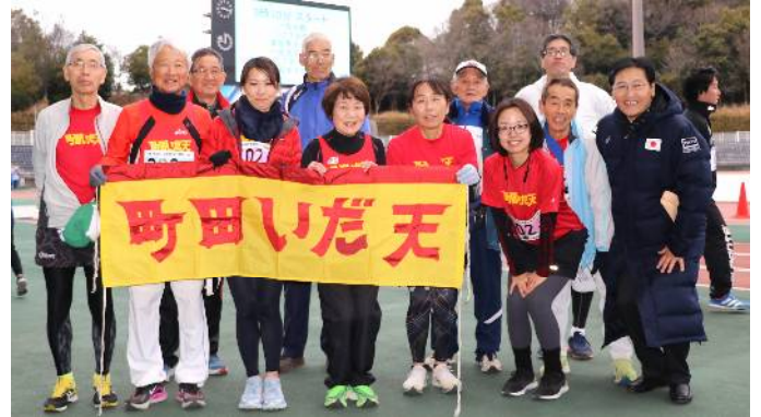
1月28日 武相駅伝参加者 (町田市陸上競技場)