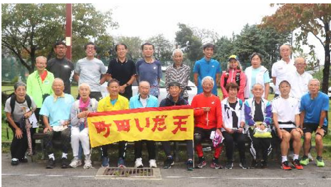
10月6日練習会参加者 (サン町田旭体育館裏)