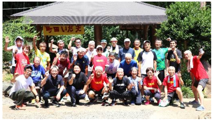
バーベキュー大会(8月4日) 隣のグループ含め、大勢のバーベキュー