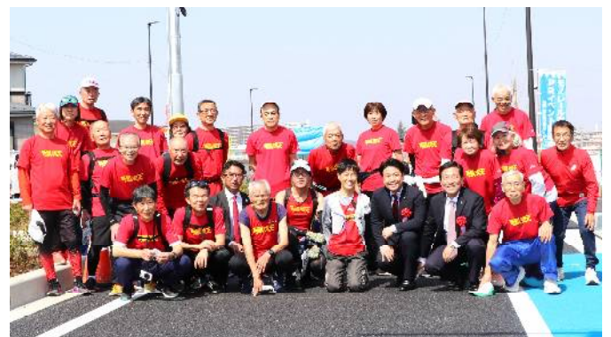
3月16日 新町田街道旭町区間開通イベント参加者 (町田3・3・36号線 26名参加)