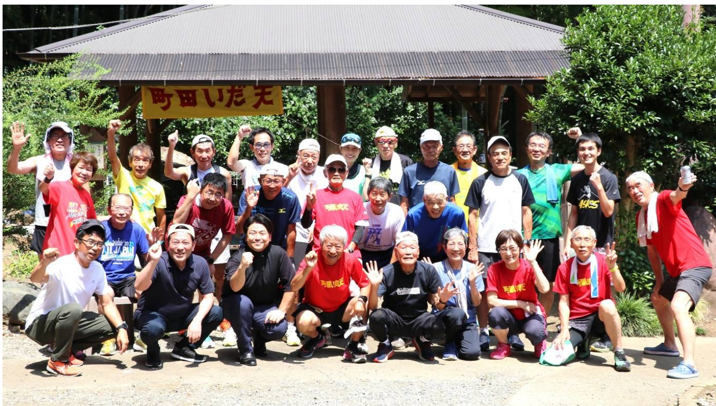
8月4日 バーベキュー参加者(竹一ガーデン)