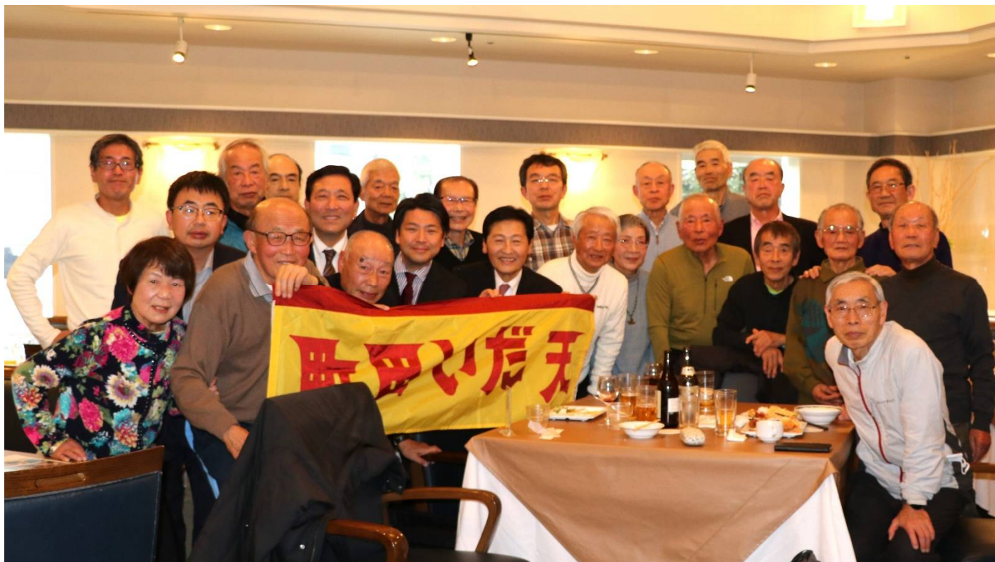
1月21日 新年会参加者(レンブラントホテルパームツリー)