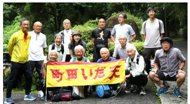
6月30日 夏季合宿 (神奈川大学保養所)