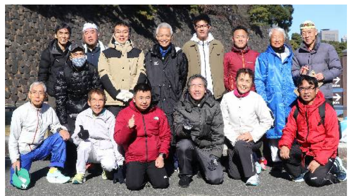
令和6年忘年親睦駅伝(12月15日) (皇居 桜田門)