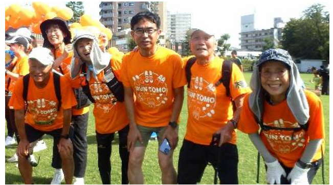
RUN伴2024(9月8日)(シバヒロにて) いだ天クラブ9名参加