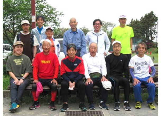
4月21日(日)練習会参加者(サン町田旭体育館裏)