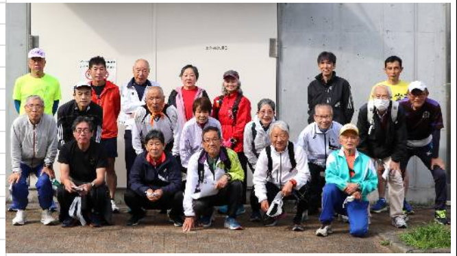
4月7日(日)練習会参加者(サン町田旭体育館裏)