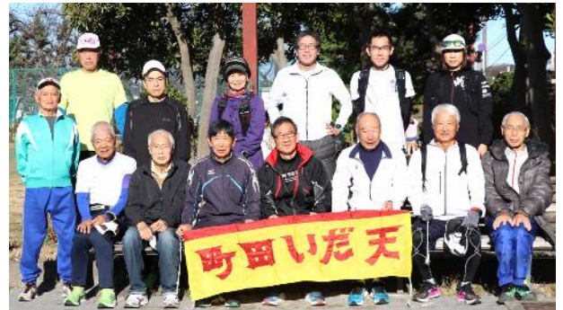
12月17日練習会集合者(サン町田旭体育館裏)