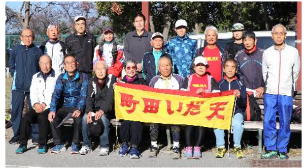
12月3日練習会参加者(サン町田旭体育館裏)