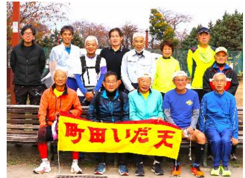
11月20日練習会参加者 (サン町田旭体育館裏)