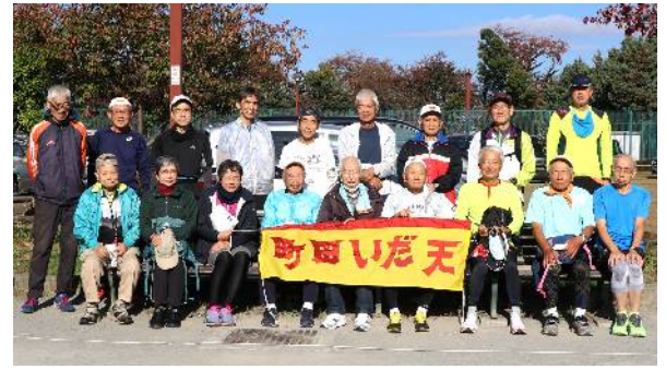
11月6日練習会参加者 (サン町田旭体育館裏)