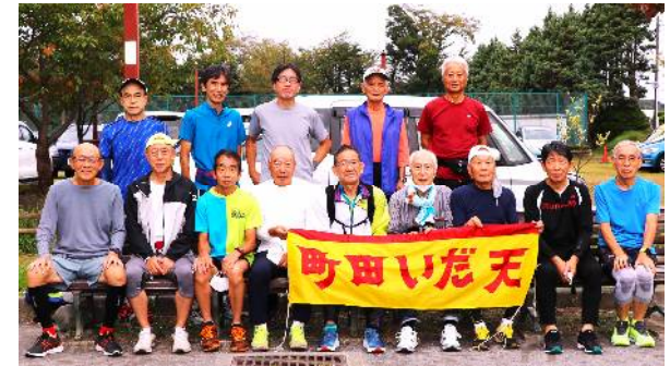
10月16日練習会参加者 (サン町田旭体育館裏)