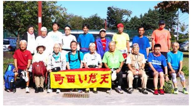
10月2日練習会参加者 (サン町田旭体育館裏)