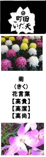
菊 (きく) 花言葉 【高貴】【高潔】【高尚】