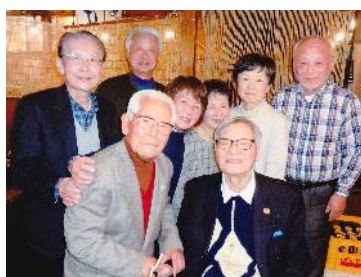
小杉会長(中央右)を囲んで