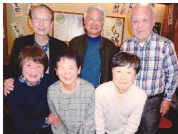
東京レディースと