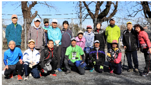
インターバル速歩実技講習(町田中央公園)