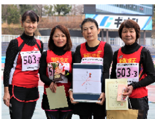
武相駅伝 シニア女子1位 町田いだ天女子チーム