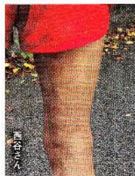
いずれも走る瞬間！