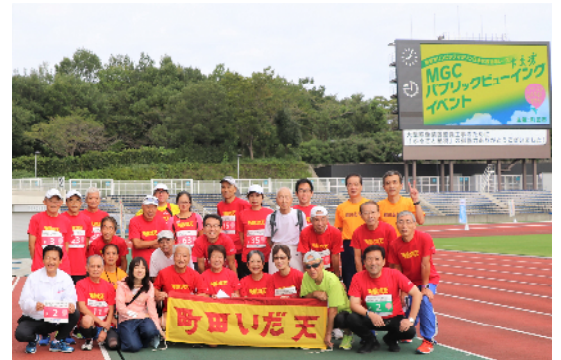
MGC応援プロジェクトに集合のいだ天クラブ