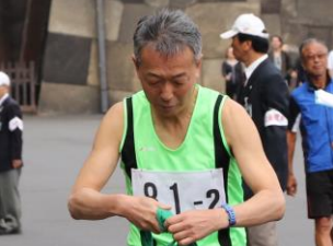
レディース応援団2区 (板井一広)