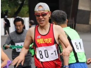
町田いだ天B1区(長内一)