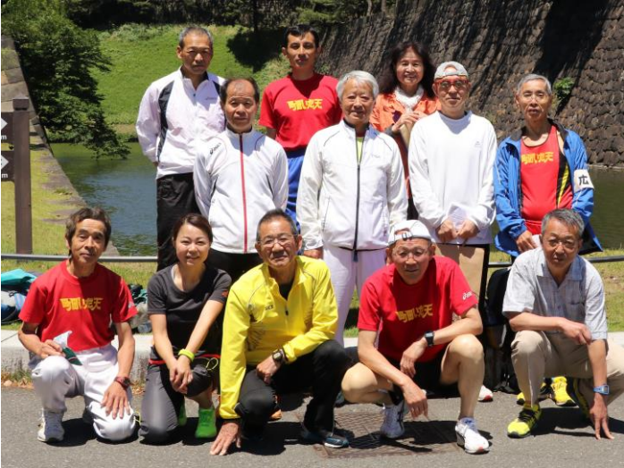
年齢別駅伝完走後の集合写真(皇居前)