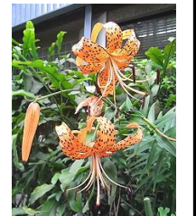
鬼百合 (おにゆり) 花言葉: 【賢者】