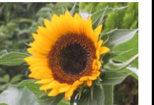
向日葵 (ひまわり) 花言葉: 「私の目は あなただけを 見つめる」