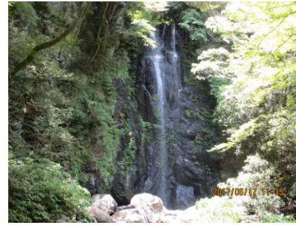
天照山コースの白雲の滝