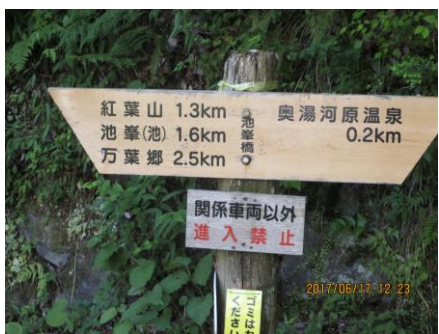
紅葉山入り口の道標