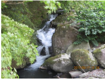
池峯橋から見た上流の川の流れ