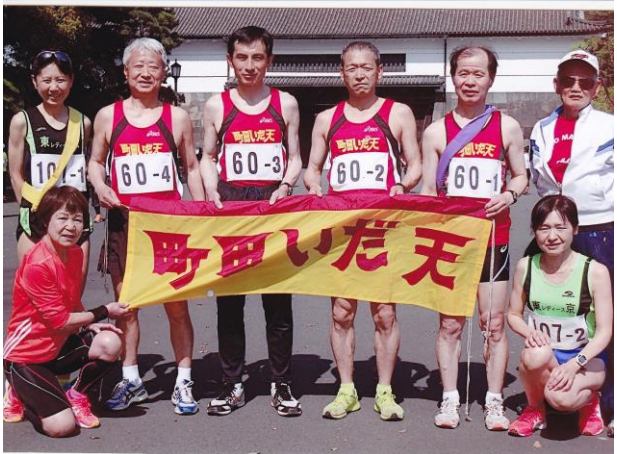
東日本年齢別駅伝4/16 壮年男子4位入賞

東京走友連合理事会参加報告(5/16) 日時 平成29年5月16日 18時～19時 場所 新宿区立戸塚地域センター5F会議室 議題