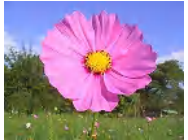
秋桜 (コスモス) 花言葉: 「純潔」「調和」